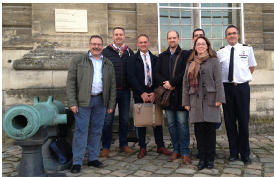
La division Patrimoine de l'Armée de l'Air au Service Historique de la Défense à Vincennes.

Enfin, je poursuivrai, à l'instar de mes prédécesseurs, le principe des visites in situ auprès des musées, associations et amicales partenaires sans lesquels la préservation du patrimoine de l'Armée de l'Air n'aurait pas été possible, dans un programme intégré à celui des visites de bases aériennes qui restent les témoins privilégiés de l'Histoire et des Hommes qui l'ont vécue, allant ainsi à la rencontre de nos délégués du patrimoine qui font tous un travail remarquable avec une volonté indéfectible.