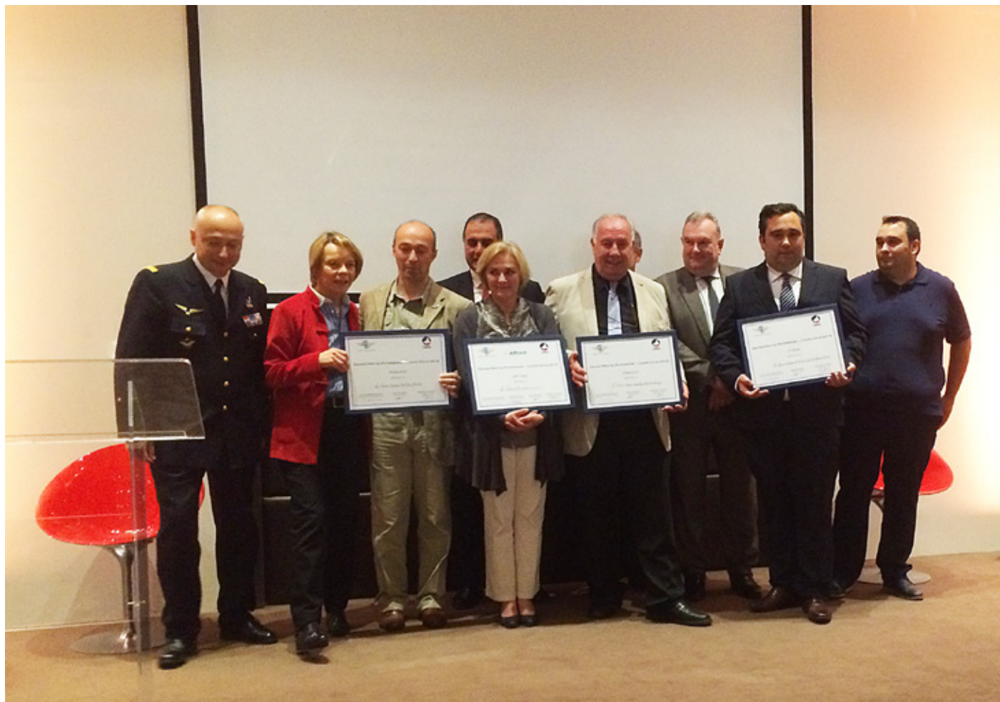
Remise des Prix du GPP 2016

Ce 19 janvier elle a reconduit à l'unanimité le bureau sortant. Vous retrouverez en détail sa composition en 1ère page.