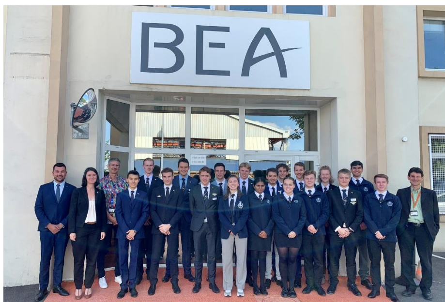
Délégation étrangère des Cadets de l'Air 2022 lors de la visite du BEA

Toutes ces visites ont contribué à la richesse aéronautique de l'échange grâce à la mobilisation totale de nos partenaires.