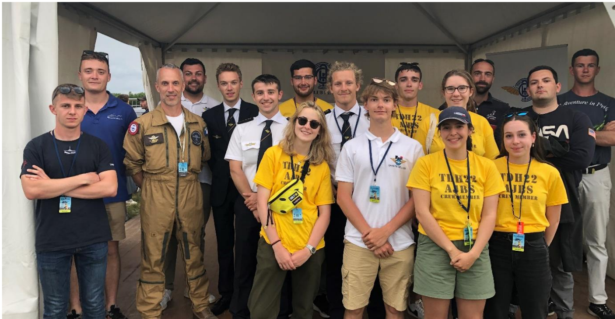
Une partie des Cadets de l'Air français 2022 bénévoles au meeting aérien Le Temps des Hélices sur le stand de l'Aéro-Club de France avec des anciens Cadets

A l'issu de ce weekend de sélections, 17 candidats ont été retenus. La commission Cadets de l'Air offrant chaque année une place à un élève de l' Ecole des Pupilles de l'Air , sélectionné par son Commandant, le groupe de 18 Cadets de l'Air français est donc formé.