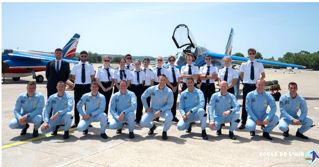
Une partie de la promotion de Cadets de l'Air français à l'occasion de la Journée en immersion avec la Patrouille de France

Au total plus de 60 Cadets de l'Air ont pu prendre part à cet échange dont 18 Français . Pendant ce temps nous avons reçu 17 Cadets de l'Air étrangers issus de ces mêmes pays en France. Le Royaume-Uni nous a offert la possibilité de sélectionner un Cadet supplémentaire (6 Cadets français au Royaume-Uni contre 5 Cadets britanniques en France).